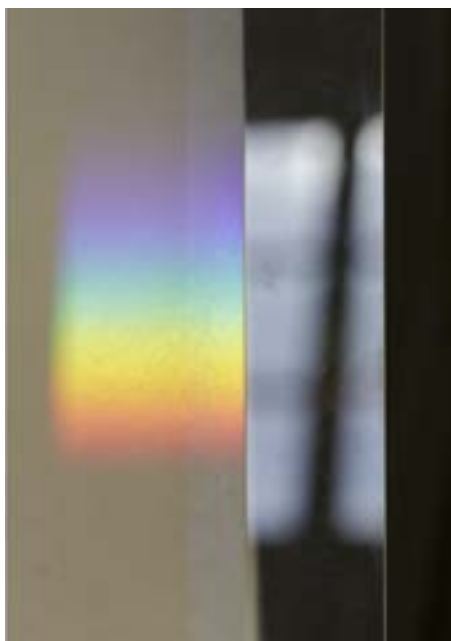
Écrire avec le soleil