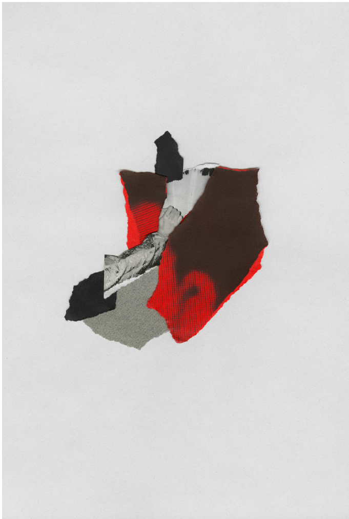
Prune Phi, «Appel Manqué», 2018 photographies, collages, ruban adhésif