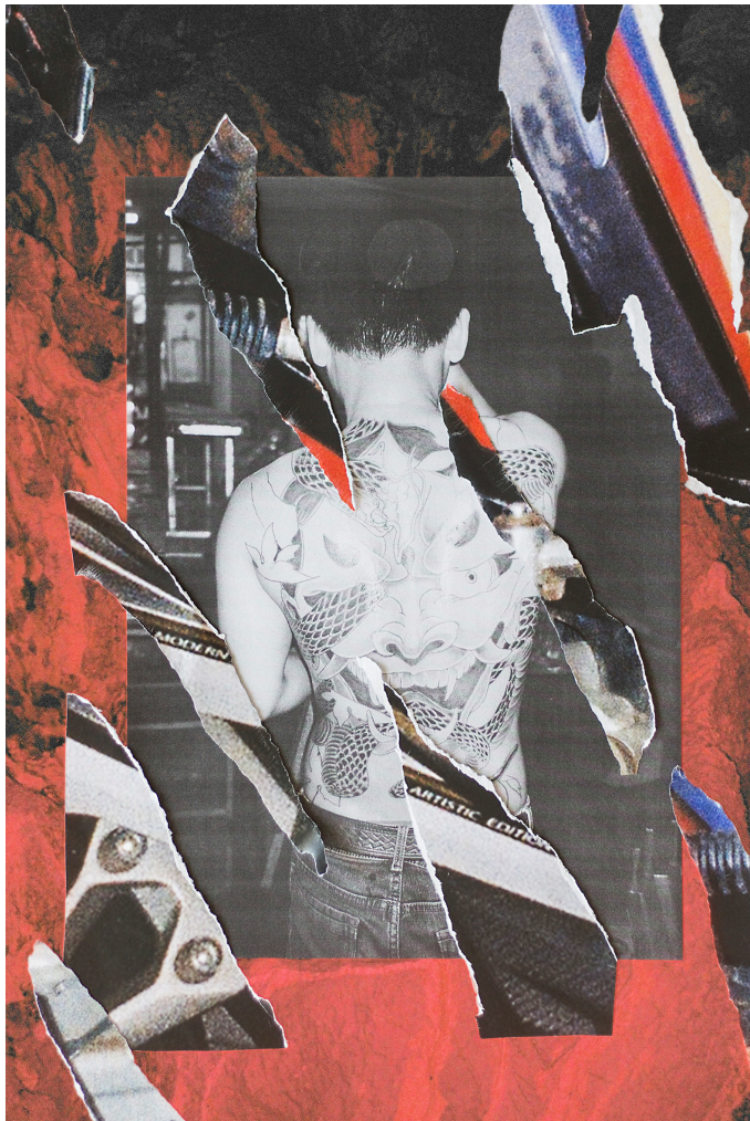
Prune Phi, «Hang up», 2019, Photographies, papier, stickers pour scooters, métal, cadres de plaque d'immatriculation