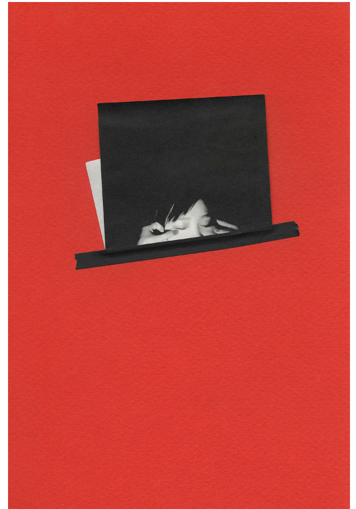
Prune Phi, «Appel Manqué», 2018 photographies, collages, ruban adhésif