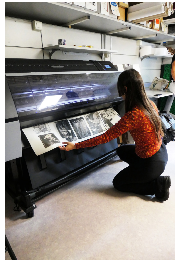
Prune Phi en résidence au musée Nicéphore Niépce